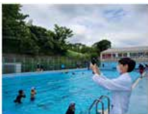
水泳プールの管理