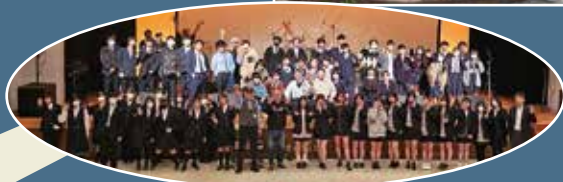
第11回 チャリティーコンサート