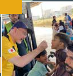
ポリオ撲滅運動 パキスタンにて