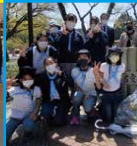
ガールスカウトとクリーン作戦