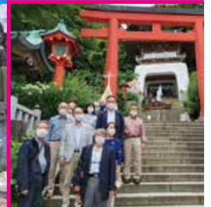
鎌倉・江の島へ親睦旅行