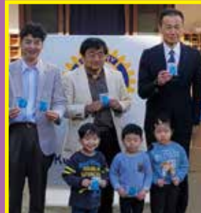
横浜市幼稚園協会へエコペーパー石鹸配布

例会場 二俣川相鉄ライフ 4Fコミュニティサロン 例会日 毎週水曜日／12時30分～1時30分