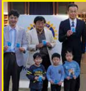
横浜市幼稚園協会へエコペーパー石鹸配布

例会場 二俣川相鉄ライフ 4Fコミュニティサロン 例会日 毎週水曜日／12時30分～1時30分