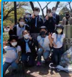
ガールスカウトとクリーン作戦