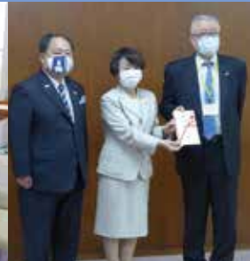
横浜市へ医療機器支援