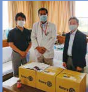
横浜西部病院へフェイスシールド寄贈

事務所 横浜市旭区二俣川1-37-3 NUTS1階／〒241-0821 TEL.045-465-6702／FAX.045-465-6712 http://yokohamaasahirc.cho88.com Email: asahirc@titan.ocn.ne.jp 例会場 横浜市旭区二俣川1-45-30工藤ビル (榎岡田屋3階会議室) 例会日 毎週水曜日／12時30分～1時30分