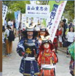
旭ふれあい区民まつり