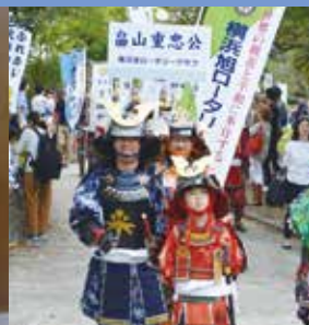
旭ふれあい区民まつり