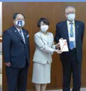
横浜市へ医療機器支援