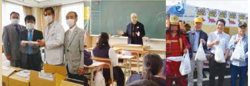
横浜西部病院へフェイスシールド寄贈