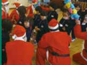
被災地の子ども達にXマスプレゼント