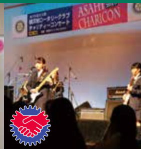
チャリティーコンサート