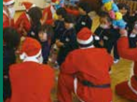
被災地の子ども達にXマスプレゼント