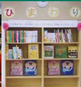
在日外国人日本語学習支援