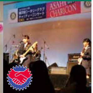
チャリティーコンサート