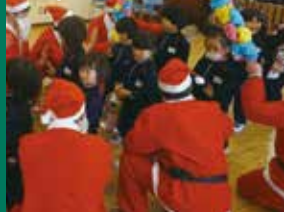
被災地の子供達にクリスマスプレゼント