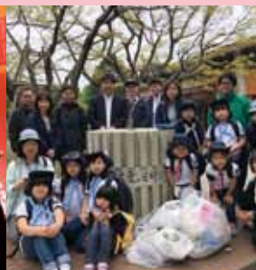
ガールスカウトとクリーン作戦