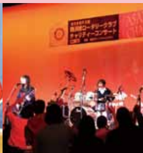
チャリティーコンサート