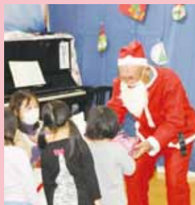
被災地の子ども達にXマスプレゼント