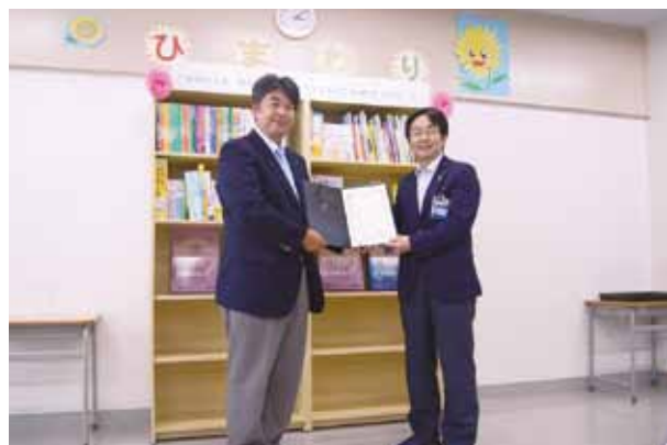
上：感謝状 下：寄贈した図書

ひまわりを運営している横浜市教育委員会の方々から、くれぐれも、皆様に宜しくお伝えくださいとのことでしたので、ご報告致します。