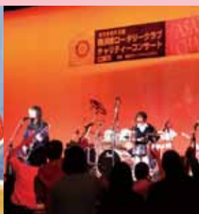
チャリティーコンサート