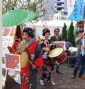
旭区民まつりにて熊本みかん販売