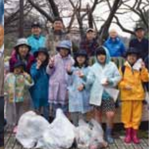
ガールスカウトとクリーン作戦

2017年11月29日 第2316回例会 VOL. 49 No. 21 夜間例会