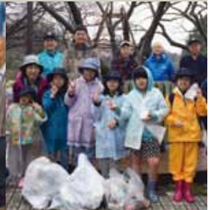
ガールスカウトとクリーン作戦