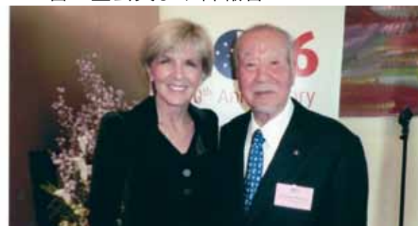
ジェリー・ビショップ外務大臣と

日豪友好基本条約(1976年)40周年記念レセプションが、2月16日(火)駐日大使公邸で開催され、出席してきました。