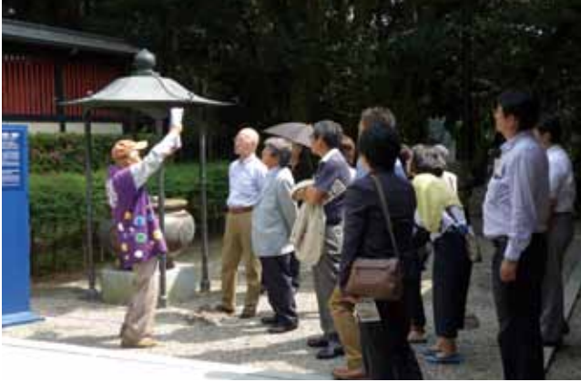
6月13日仙台藩祖 伊達政宗公霊屋 瑞鳳殿