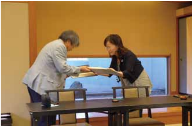
6月13日災害時相互支援協定締結式