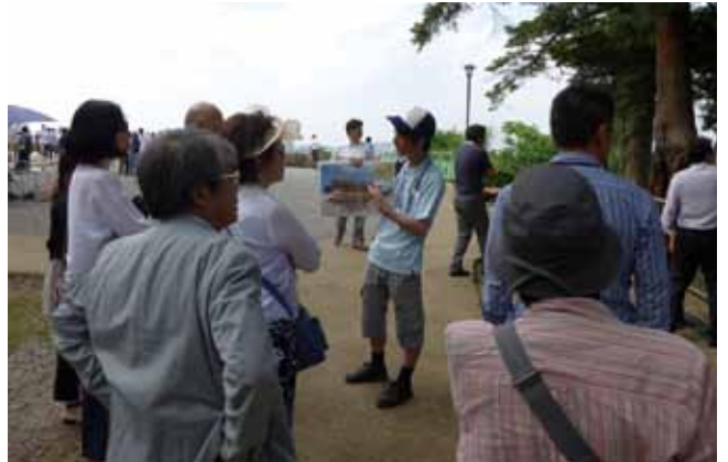
6月13日仙台城（青葉城）見学