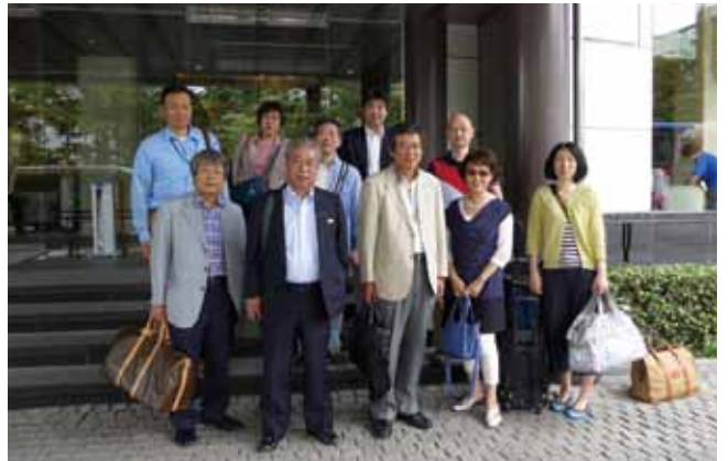
6月14日宿泊ホテルニュー水戸屋前にて